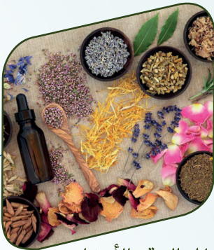
المعالجة بالأعشاب Herbal therapy