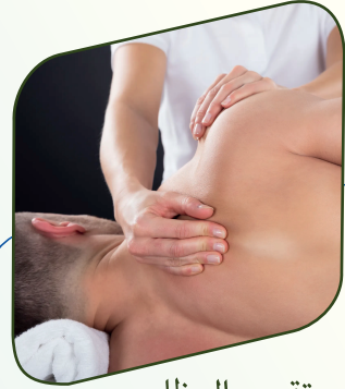
تقويم العظام Osteopathy