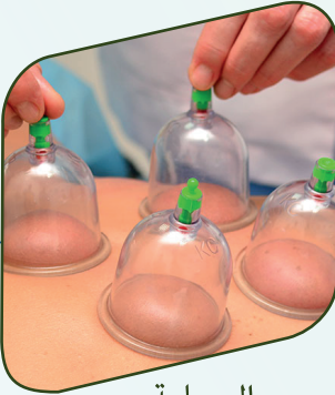
الحجامة Cupping Therapy

Accredited Complementary Medicine Practices in Kingdom of Saudi Arabia