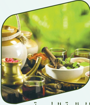
المعالجة الطبيعية Naturopathy